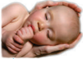
نیند کے دوران چوسنے کا طرز عمل