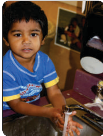
منہ ہاتھ دھونے کی کوشش کرنا