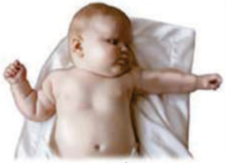
دیکھنے کی حس