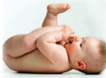
چوسنے کا رد عمل