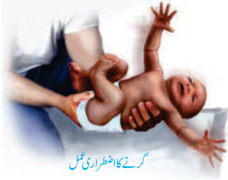
گرنے کا اضطراری عمل