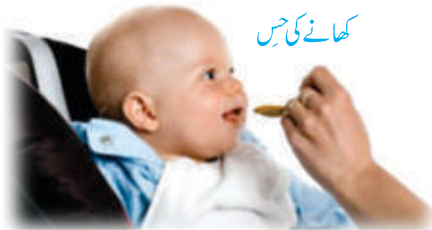
کھانے کی حس