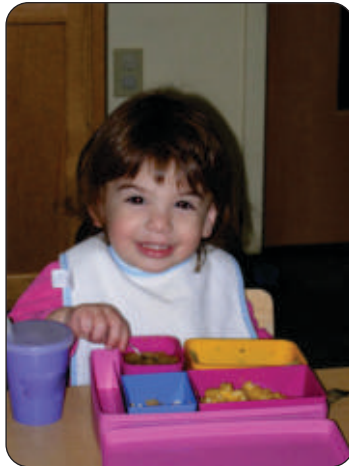
کھانا خود کھانے کی کوشش کرنا

بچہ ماحول سے مطابقت پیدا کرنے اور معاشرے میں قابل قبول حیثیت بنانے کے لیے مختلف عادات اپنانے کی کوشش کرتے ہیں۔ مثلاً تین چار سال کی عمر میں وہ خود انحصاری کا مظاہرہ کرتے ہوئے خود کھانا کھانا سیکھ لیتا ہے۔ اپنے کپڑے خود پہن کر تیار ہونے، جرابیں خود پہننے، لباس کے بٹن اور جوتوں کے تسمے بھی بند کرنے کی کوشش کرتا ہے۔ اگر اس عمر میں بچہ کی حوصلہ افزائی کی جائے تو وہ جلد خود مختار ہو جاتا ہے۔ تین سے پانچ سال کی عمر کا بچہ دانت برش کرنے، منہ ہاتھ دھونے، نہانے اور بول و براز کی تربیت بھی حاصل کر لیتا ہے۔