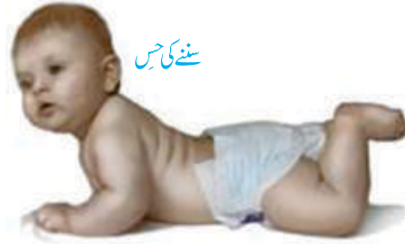
سننے کی حس