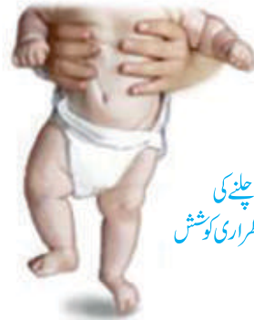
چلنے کی غیر اضطراری کوشش