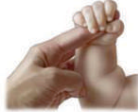
پکڑنے کا رد عمل